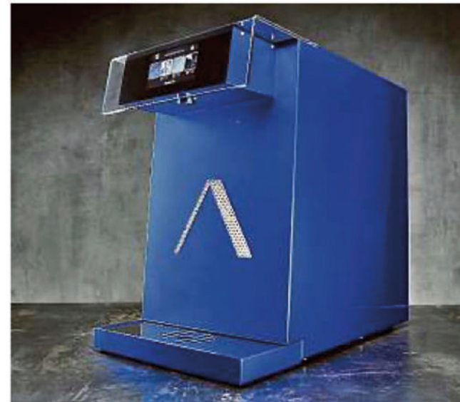
Die Wasseraufbereitungsanlage „Evolution Sky Edition“ der Firma Membratech stellt sich auch dem German Design Award.

„Die leistungsstarken Wasseraufbereitungsanlagen entfernen mit ihren fortschrittlichen Hydrocarbon Membranen – eine Weltneuheit – selbst kleine molekulare Fremdstoffe wie Viren, Hormone, Arzneimittelrückstände, Chemikalien und Mikroplastik sicher aus dem Wasser – und das weltweit